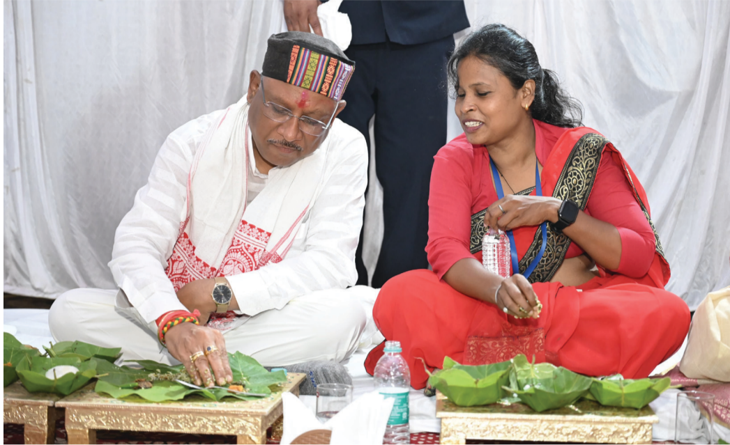
मुख्यमंत्री श्री विष्णु देव साय ने स्वच्छता दीदियों के साथ पत्तों से बनी पतरी और दोने पर भोजन किया...