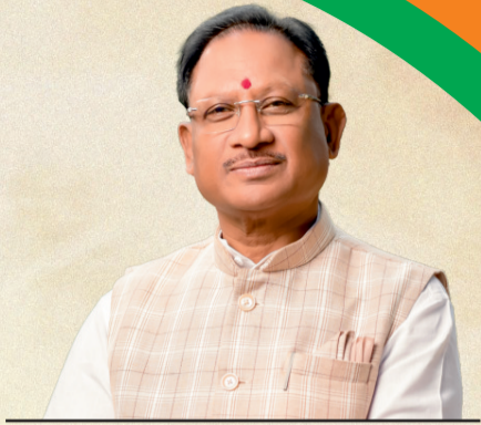
श्री विष्णु देव साय मुख्यमंत्री, छत्तीसगढ़