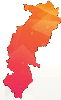
श्री विष्णु देव साय मुख्यमंत्री, छत्तीसगढ़