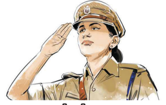
भारतीय वीरता पदक