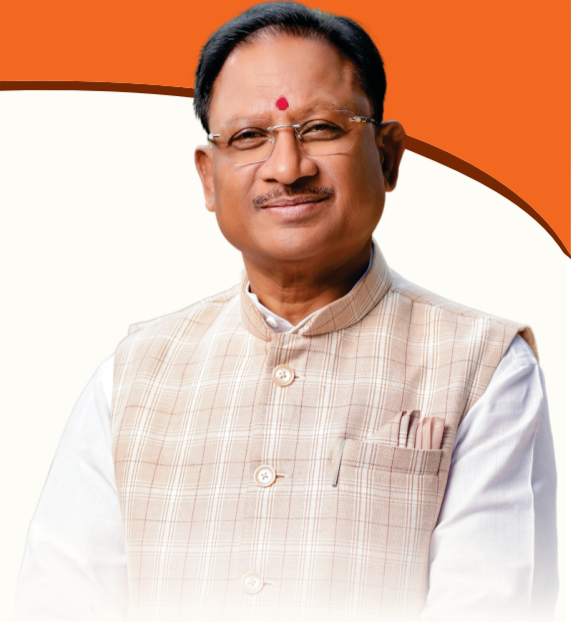
श्री विष्णु देव साय मुख्यमंत्री, छत्तीसगढ़