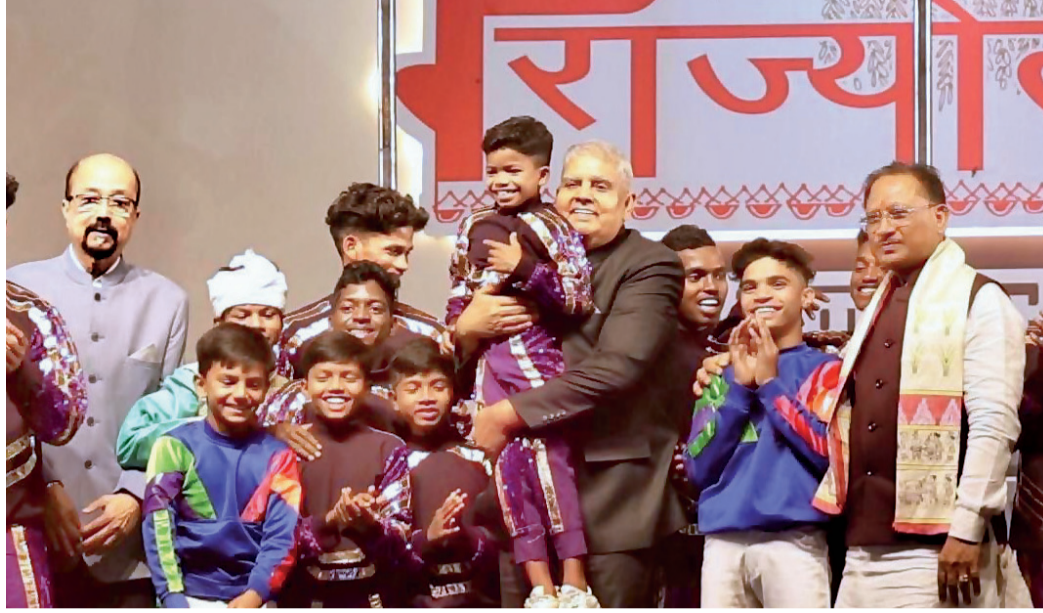
अबूझमाड़ के बच्चों के मलखंभ का अद्भुत प्रदर्शन देख उपराष्ट्रपति कि इतने गदगद हुए बच्चे को गोद में उठा लिया