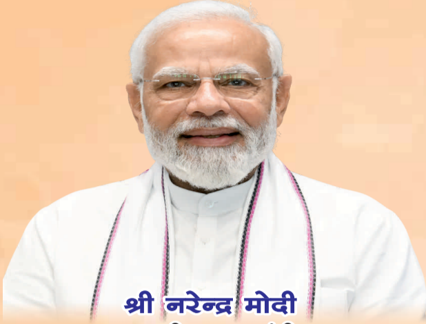
श्री नरेन्द्र मोदी माननीय प्रधानमंत्री