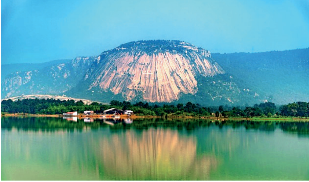
जशपुर पर्यटन वेबसाइट में शामिल होने वाला प्रदेश का पहला जिला