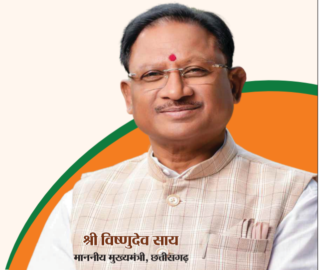
श्री विष्णुदेव साय माननीय मुख्यमंत्री, छत्तीसगढ़