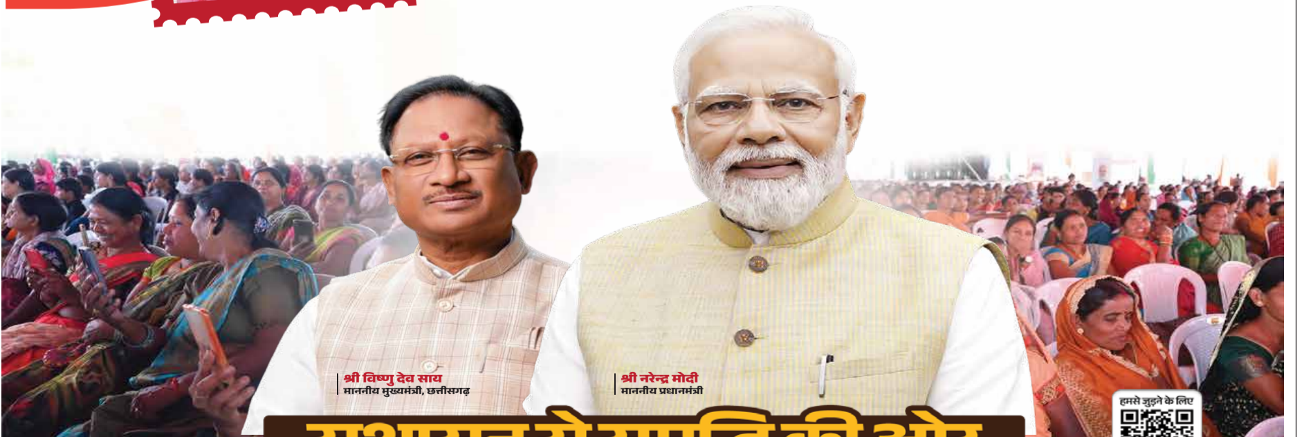
श्री विष्णु देव साय माननीय मुख्यमंत्री, छत्तीसगढ़