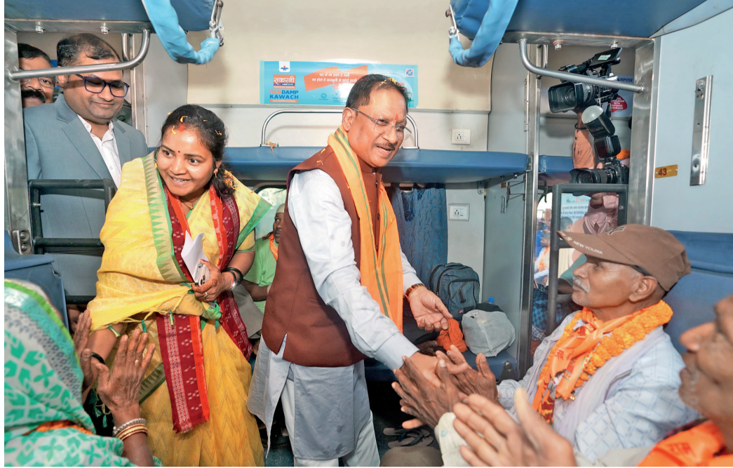
बुजुर्ग श्रद्धालुओं को 'मुख्यमंत्री तीर्थ दर्शन योजना' तहत तिरुपति, मद्रुरै और रामेश्वरम के लिए रवाना करते हुए मुख्यमंत्री श्री साय