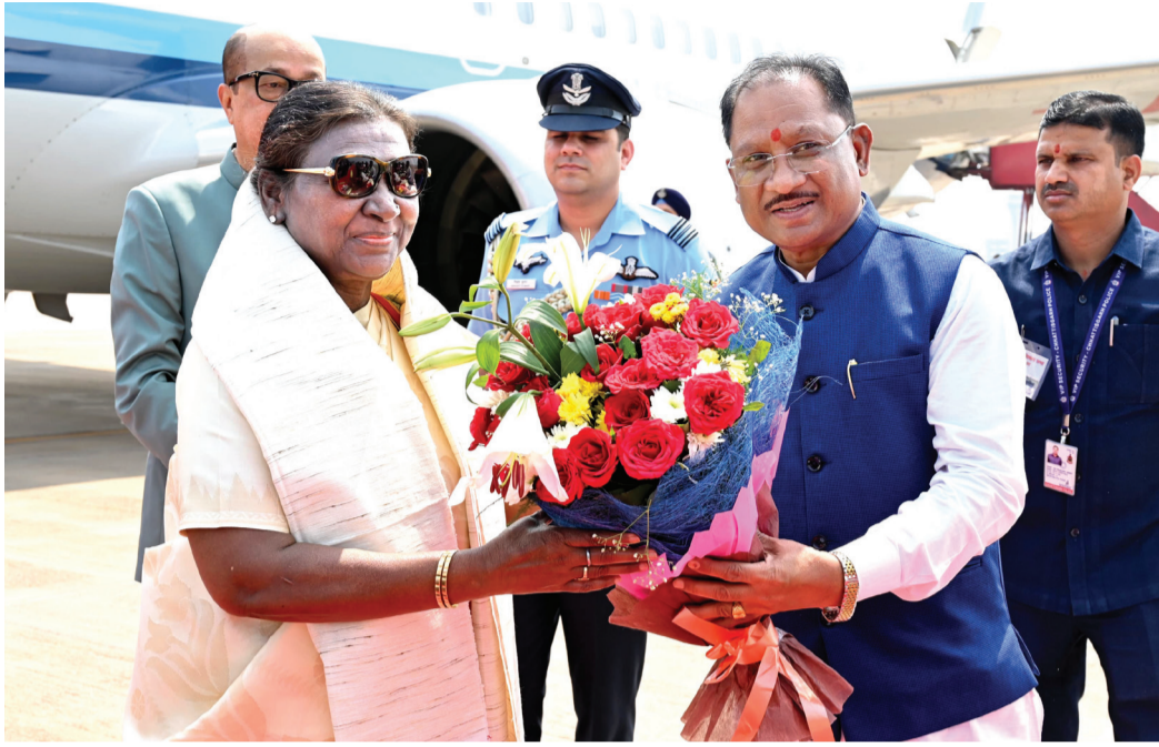
राष्ट्रपति श्रीमती द्रौपदी मुर्मु का छत्तीसगढ़ आगमन, एयरपोर्ट पर हुआ मध्य स्वागत