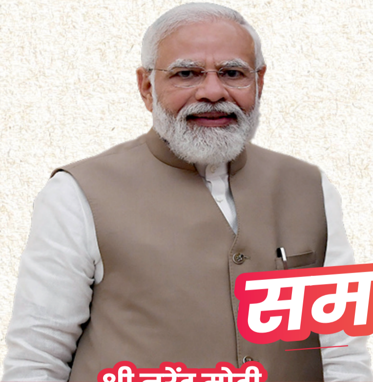
श्री नरेंद्र मोदी माननीय प्रधानमंत्री