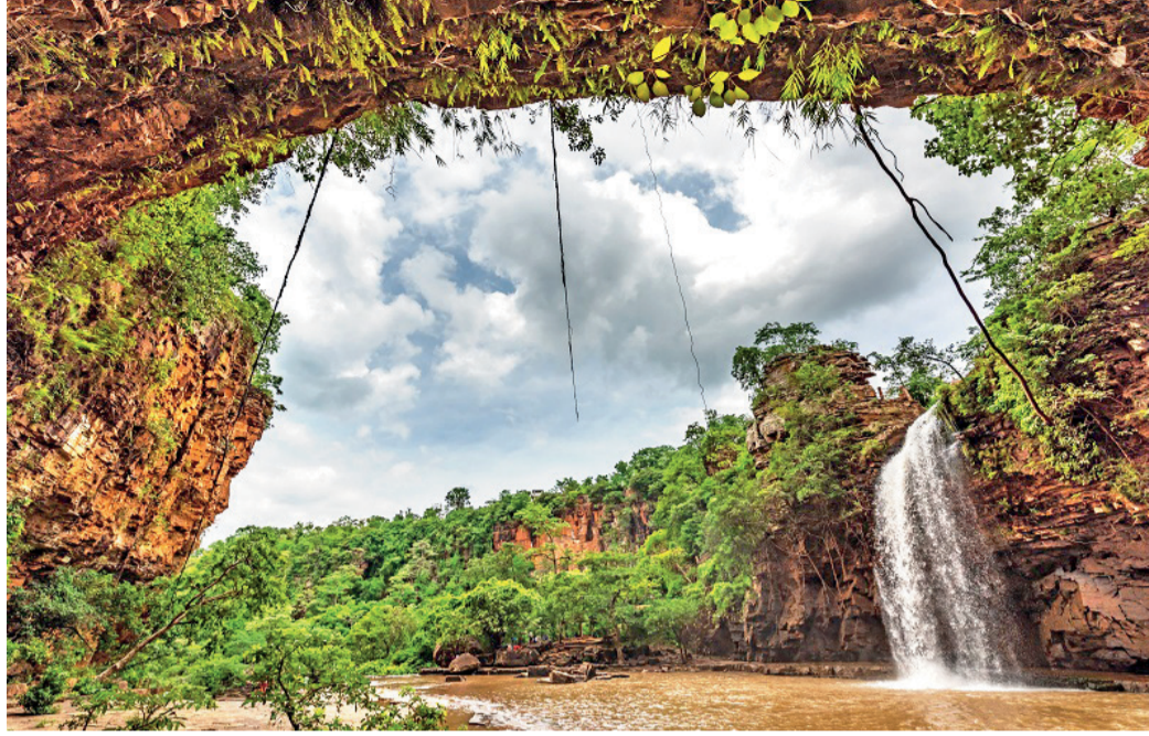
भारत के सबसे सुंदर जलप्रपातों में से एक जलप्रपात कांगेर घाटी राष्ट्रीय उद्यान के भीतर स्थित है।