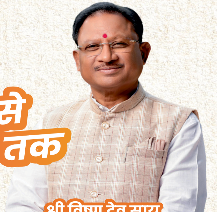
श्री विष्णु देव साय माननीय मुख्यमंत्री, उत्तीसगढ