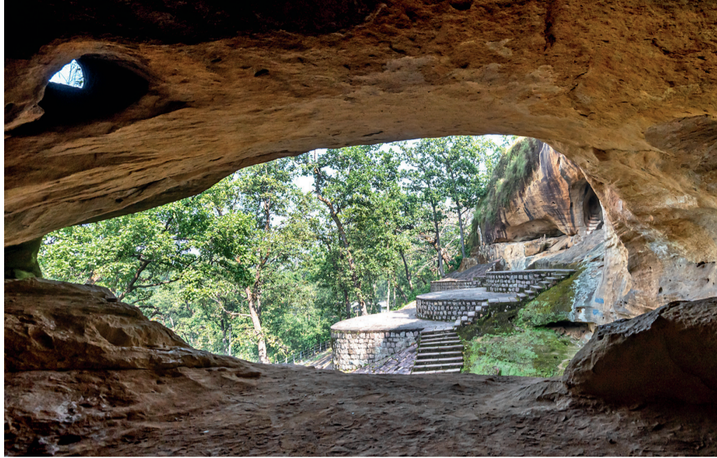
रामगढ़ पर्वत (अंबिकापुर) के निचले शिखर पर सीताबेगवा नाट्यशाला, एशिया की सबसे प्राचीन नाट्यशाला माना जाता है