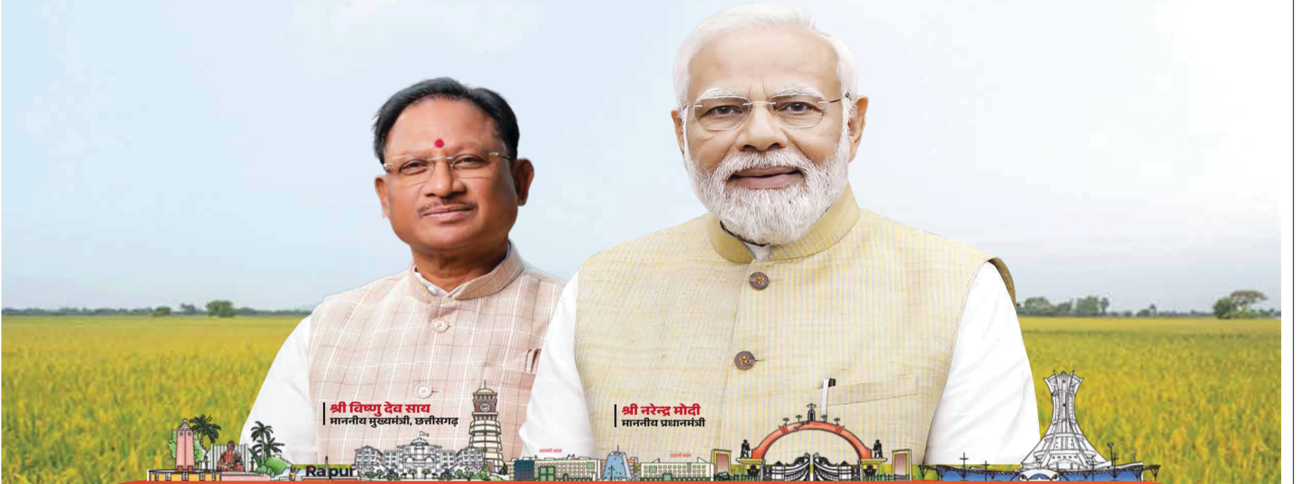
श्री विष्णु देव साय माननीय मुख्यमंत्री, छत्तीसगढ़