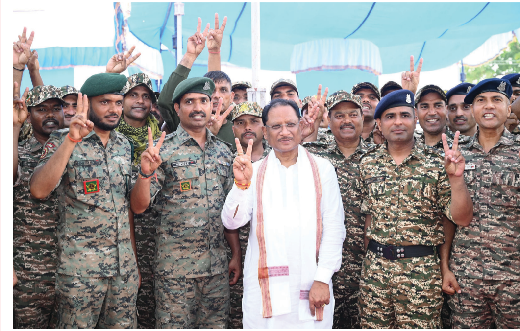
बीजापुर के अंदरूनी गांव गलगम पहुंचकर मुख्यमंत्री विष्णु देव साय ने सुरक्षा बल के जवानों का हौसला बढ़ाया।