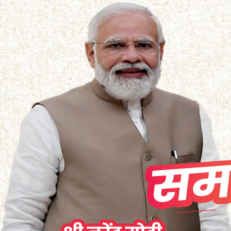
श्री नरेंद्र मोदी माननीय प्रधानमंत्री