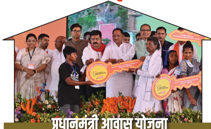
प्रधानमंत्री आवास योजना

2011 की जनगणना और 2018 की आवास प्लस सूची में शामिल सभी पात्र हितग्राहियों को अब प्रधानमंत्री आवास की स्वीकृति मिल चुकी है। राज्य में वर्षों से प्रतीक्षा कर रहे लाखों परिवारों को अब पक्के घर का सपना साकार होता नजर आ रहा है।