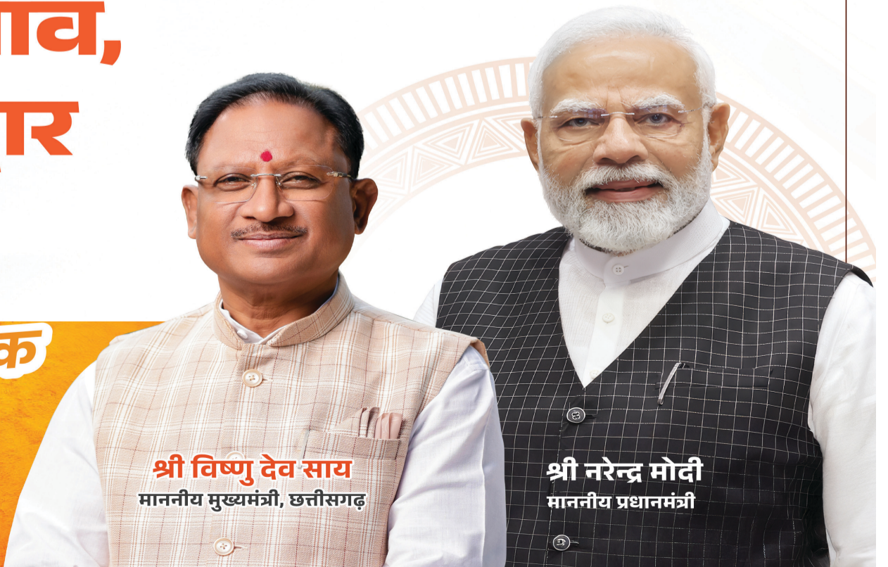
श्री विष्णु देव साय माननीय मुख्यमंत्री, छत्तीसगढ़