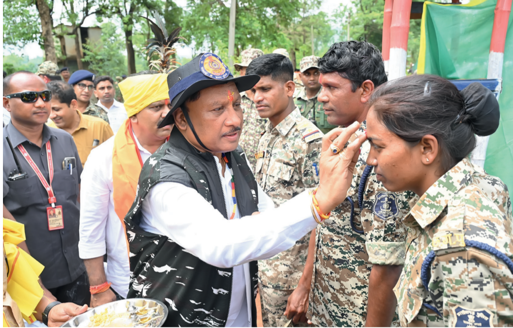
CM साय ने अबूझमाड़ में हुए सफल ऑपरेशन में शामिल जवानों से मुलाकात कर तिलक लगाकर स्वागत किया