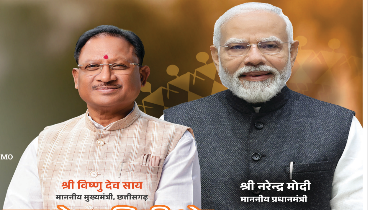
श्री विष्णु देव साय माननीय मुख्यमंत्री, छत्तीसगढ़