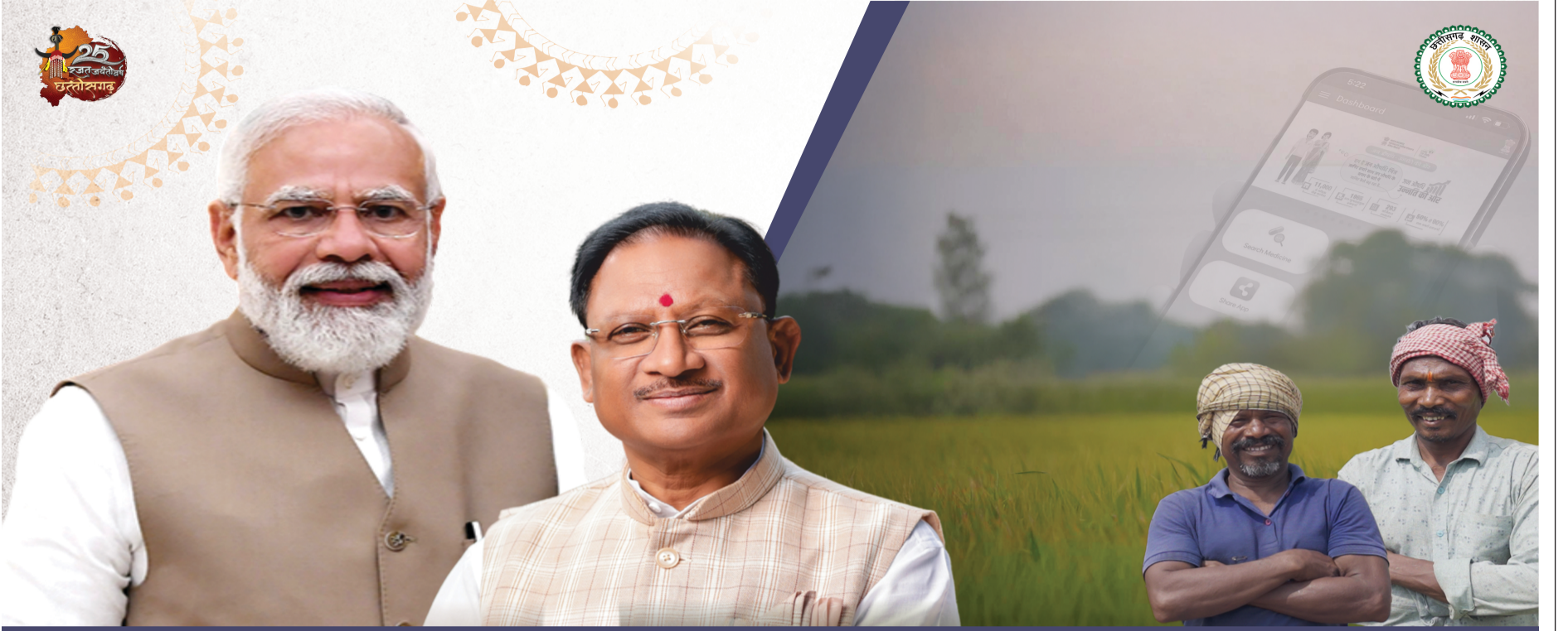
श्री नरेन्द्र मोदी माननीय प्रधानमंत्री