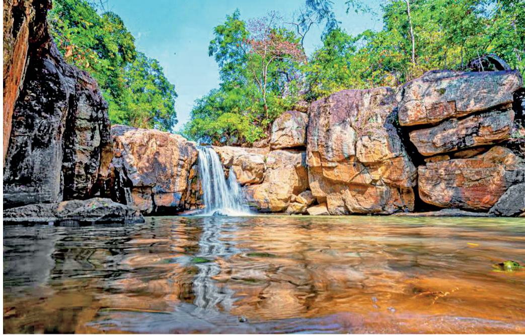
जशपुर से लगभग 15 किलोमीटर दूर स्थित भृंगराज जलप्रपात प्राकृतिक सौंदर्य और शांति का अनुपम संगम है।...