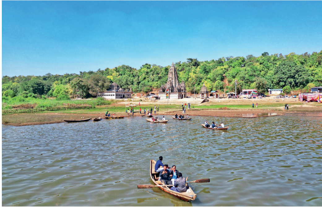
बालोद जिले के प्राकृतिक सुंदरता से परिपूर्ण 'ओनाकोना' में हर मौसम में होता है मनमोहक नजारा