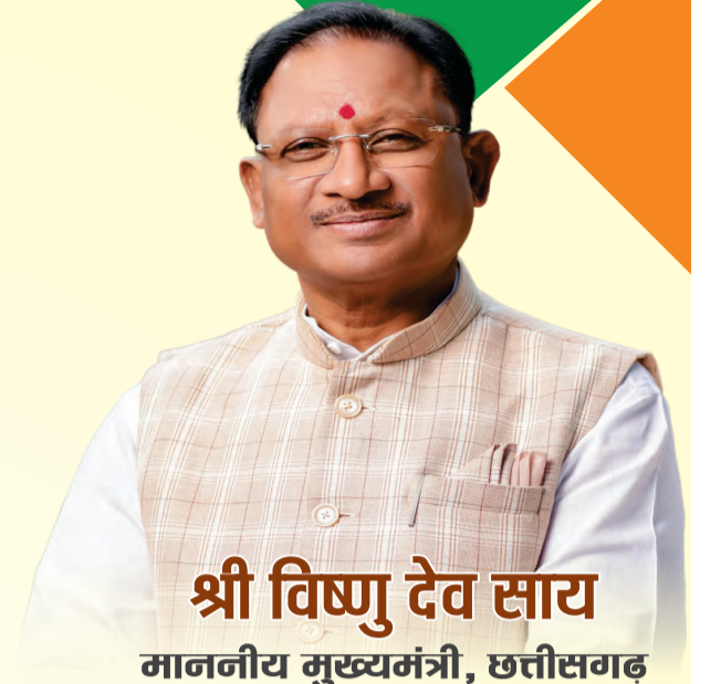
श्री विष्णु देव साय माननीय मुख्यमंत्री, छत्तीसगढ़