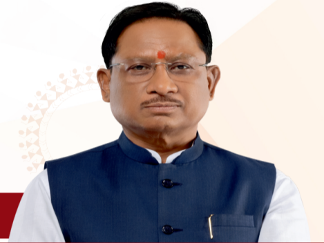
श्री विष्णु देव साय मान. मुख्यमंत्री छत्तीसगढ़